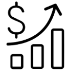
Net Gelirde Artış